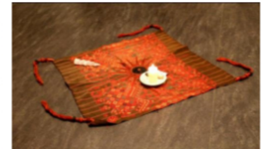
Begegnungstag Union 2014