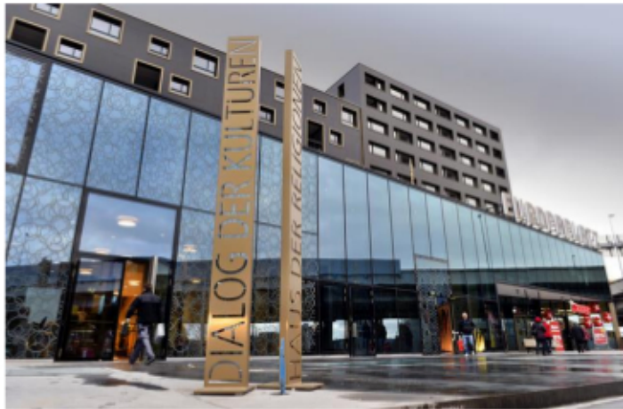
Haus der Religionen – Dialog der Kulturen